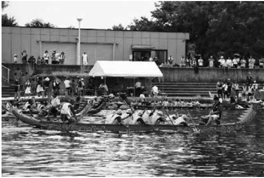
芦屋カップドラゴンボートレース大会の様子